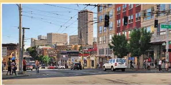
Broadway & Pine tại Capitol Hill