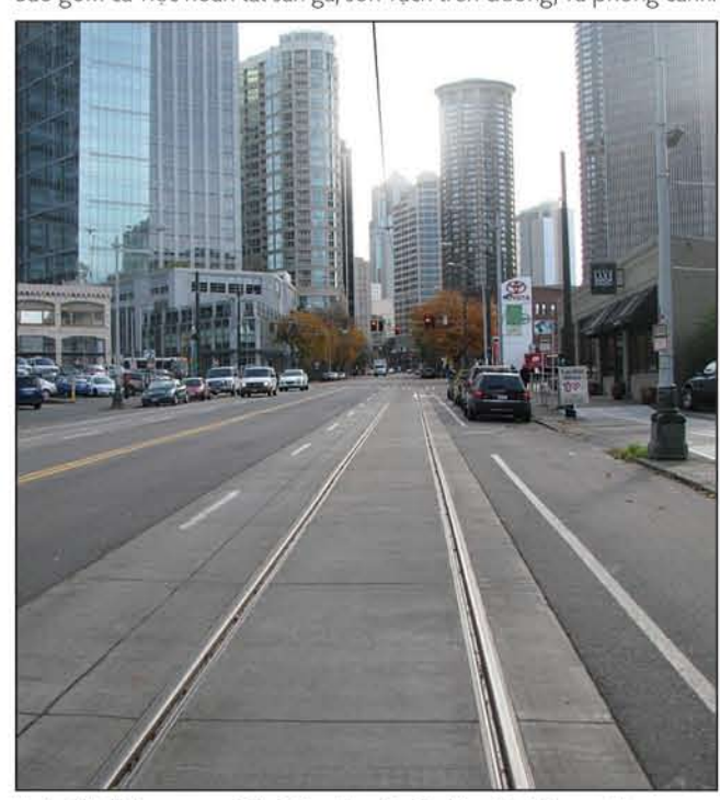
Hoàn tất đường ray xe điện ở Seattle với việc lát mặt đường cuối cùng và sơn vạch giao thông