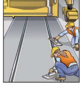
Đổ bê tông đường ray