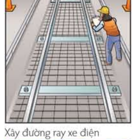
Xây đường ray xe điện