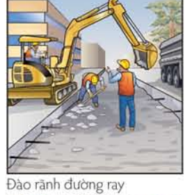
Đào rãnh đường ray