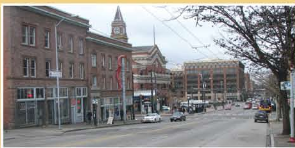
5th & Jackson ở Chinatown/International District