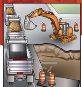
Dỡ bỏ đường hiện tại