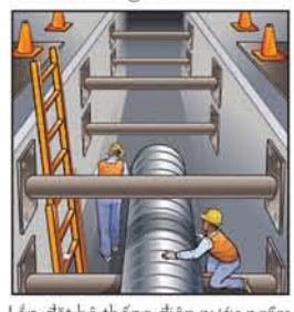
Lắp đặt hệ thống điện nước ngầm